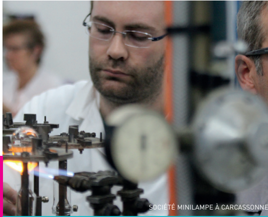
SOCIÉTÉ MINILAMPE À CARCASSONNE