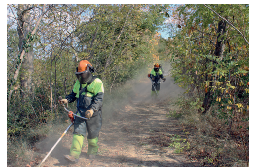
NETTOYAGE DES SENTIERS DE RANDONNÉE EN COURS SUR LES COMMUNES

C'est en ce sens qu'elle mène une réflexion pour créer un itinéraire de randonnée entre Carcassonne Agglo et la Communauté de communes Piège Lauragais Malepère. La création de ce nouvel itinéraire serait une opportunité, de