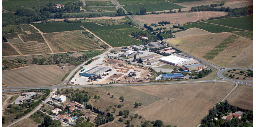
ZAE BEZONS À VILLEMUSTAUSOU

En parallèle, les équipes interviennent aussi dans le cadre de l'entretien et du nettoyage des abords des équipements d'assainissement et captages d'eau potable sur l'ensemble des communes.