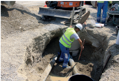
LES ÉQUIPES SUR LE TERRAIN LORS DE L'ÉPISODE ESTIVAL

À l'heure où la question sur la pertinence de services publics de qualité est posée au niveau national, notamment par une remise en cause du nombre de fonctionnaires, nous devons nous féliciter de compter dans les effectifs de Carcassonne Agglo des agents investis dans leur territoire et qui, au plus près de la population, sont des garants du respect de l'intérêt général.